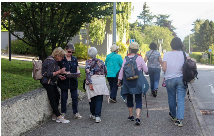
Le groupe de travail déplacements doux en balade dans les rues de la ville pour identifier les emplacements potentiels de nouvelles assises

L'équipe municipale restera toujours disponible, pour tous, pour évoquer tous les sujets communaux. Sans exception. Pour continuer de faire vivre aussi cet ADN nature et solidaire propre à notre petite commune.