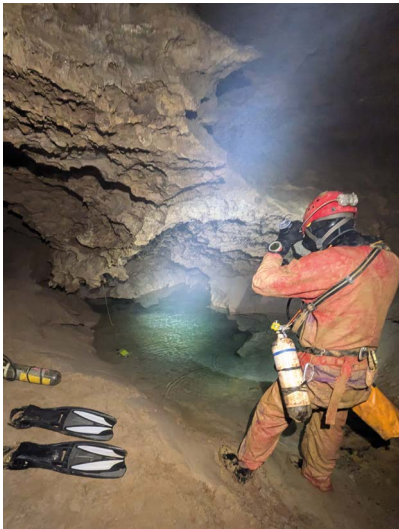
Le spéléo-plongeur se prépare à franchir le siphon qui nargue les spéléos depuis si longtemps. Derrière, l'inconnu..."