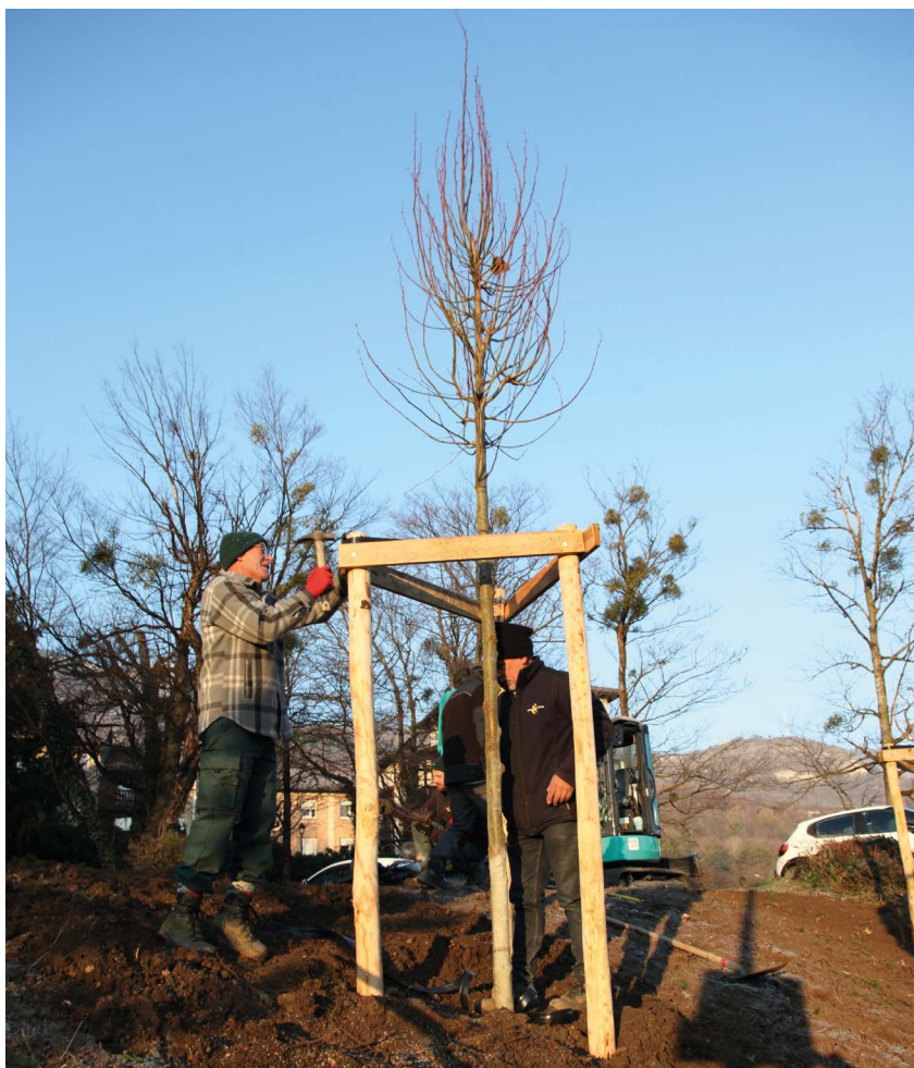
Plantation d'un tilleul à grandes feuilles et d'un érable cannelle à proximité de l'hôtel de ville

Animer le territoire est essentiel. Cela contribue à la fois à former des citoyens et à rendre la commune attractive. Nous pouvons compter sur un tissu associatif hors pair pour cela. Et la saison culturelle a gagné en qualité